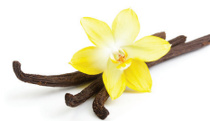
vaniglia profuma il pelo