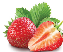
fragola profuma il pelo