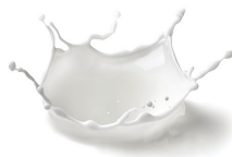
latte deterge rispettando il pH